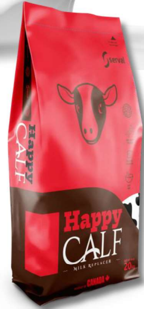
SAC DE 20 KG

Si votre objectif est d'élever des génisses comme remplacements de troupeaux ou de la viande bovine laitière, alors HAPPY Calf est pour vous.