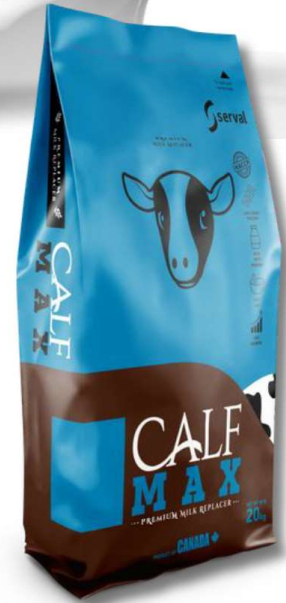
20 KG BAG